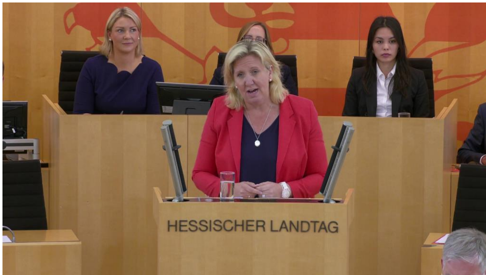
CDU-Fraktionsvorsitzende Ines Claus während der Aktuellen Stunde im Hessischen Landtag.