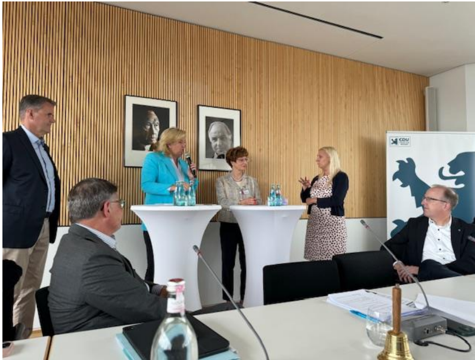
Die Vertreter der Landesapothekerkammer Hessen und des Hessischen Apothekerverbands waren von der CDU-Landtagsfraktion eingeladen worden.

Funke verdeutlichte, was dieser Gesetzesentwurf für die Patienten bedeute: „Nur während acht Stunden pro Woche soll es einen Apotheker als Ansprechpartner vor Ort geben, das dringend benötigte Schmerzmittel erhält der Palliativpatient dann erst nach Tagen.“ Die Arzneimitteltherapie werde immer komplexer, die Anwendung anspruchsvoller und komplizierter. Gerade multimorbide Patienten seien darauf angewiesen, Beratung und Hilfe bei ihrer Arzneimitteltherapie zu erhalten. „Das beste Arzneimittel wirkt nicht, wenn es falsch oder gar nicht eingenommen wird. Das ist unsere ureigenste apothekerliche Aufgabe, hier den Patienten zur Seite zu stehen“, so Funke.