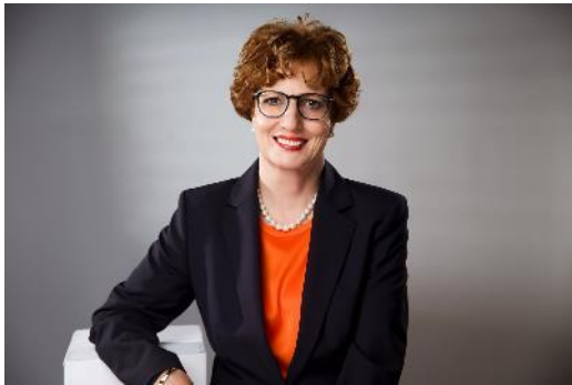
Ursula Funke, Präsidentin.