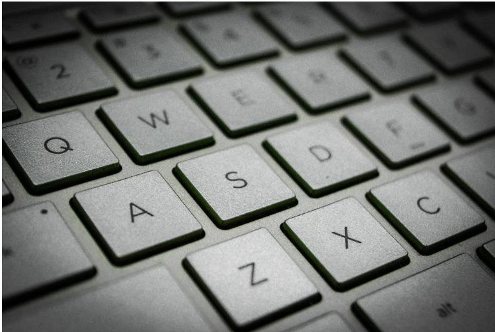
Am 15. Januar 2025 erfolgt die flächendeckende Einführung der ePA für alle gesetzlich Versicherten.