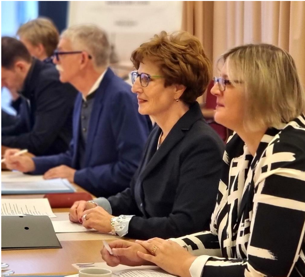
Dr. Sonja Optendrenk im Austausch mit den Delegierten.

Im Anschluss diskutierten die Delegierten mit der Staatssekretärin unter anderem über mögliche Versorgungsverbesserungen durch eine intensive Zusammenarbeit von Ärzten und Apothekern vor dem Hintergrund der Ergebnisse der ARMIN-Studie und der Notwendigkeit von Stationsapothekern im Krankenhaus. Des Weiteren brachten die Delegierten der Staatssekretärin die aktuellen Probleme der Apotheken unter anderem im Hinblick auf die weiterhin ausstehende Anpassung der Vergütung, den Wegfall des Großhandelsskontos, den Fachkräftemangel, das Retaxationsverhalten der GKV und den hohen bürokratischen Aufwand, etwa im Zusammenhang mit der Dokumentation bei der Erbringung pharmazeutischer Dienstleistungen, nahe. Dr. Optendrenk sicherte ihre Unterstützung für die Versorgung durch die Apotheke vor Ort zu.