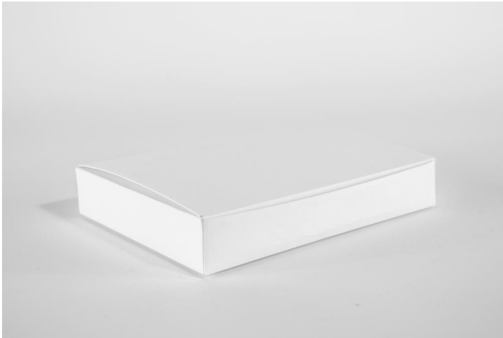
Die Regelungen des Verpackungsgesetzes betreffen auch die Apotheken in Deutschland.