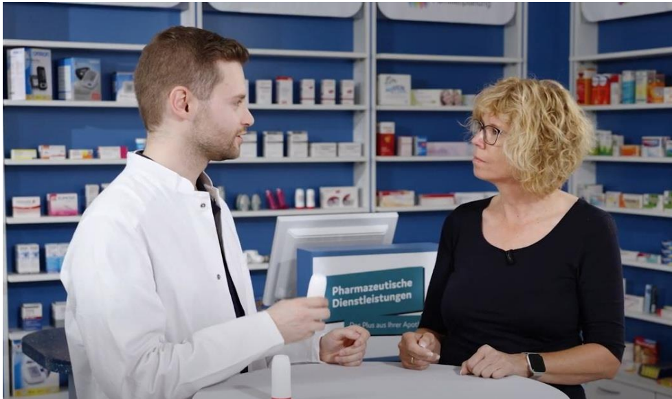
Die Bundesapothekerkammer hat eine Videoschulungsreihe zum Thema Inhalativa gestartet.